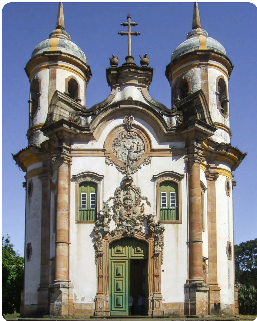
Igreja de Ouro Preto Ouro Preto - MG