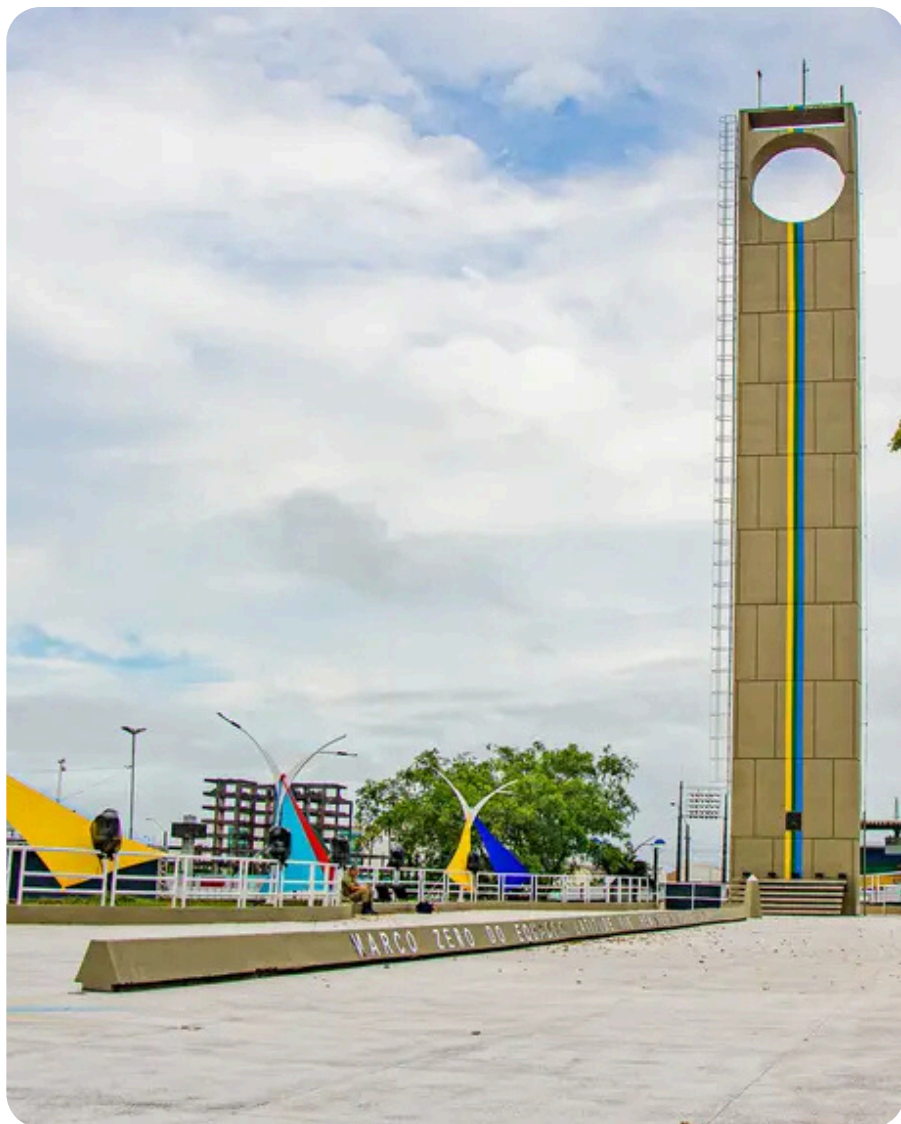
Marco Zero do Equador Macapá - AM