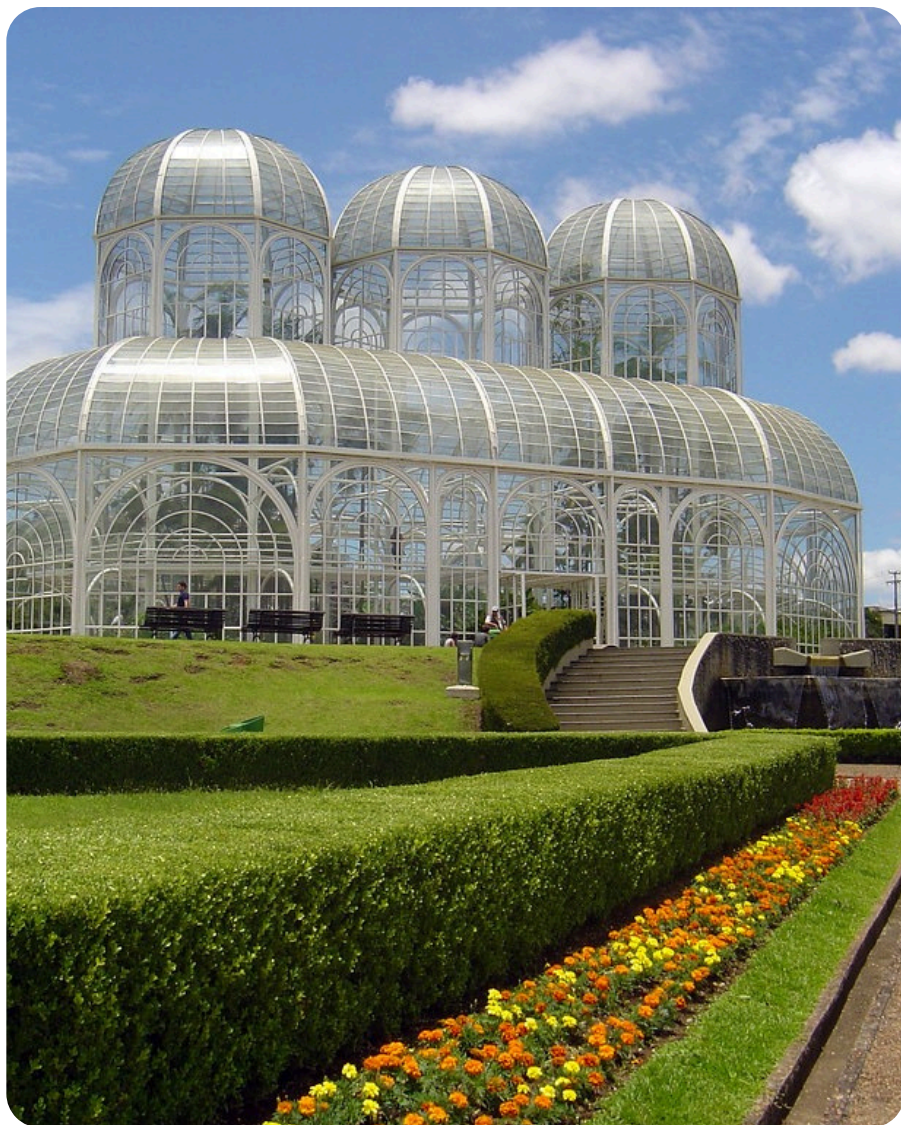
Jardim Botânico de Curitiba Curitiba - PR