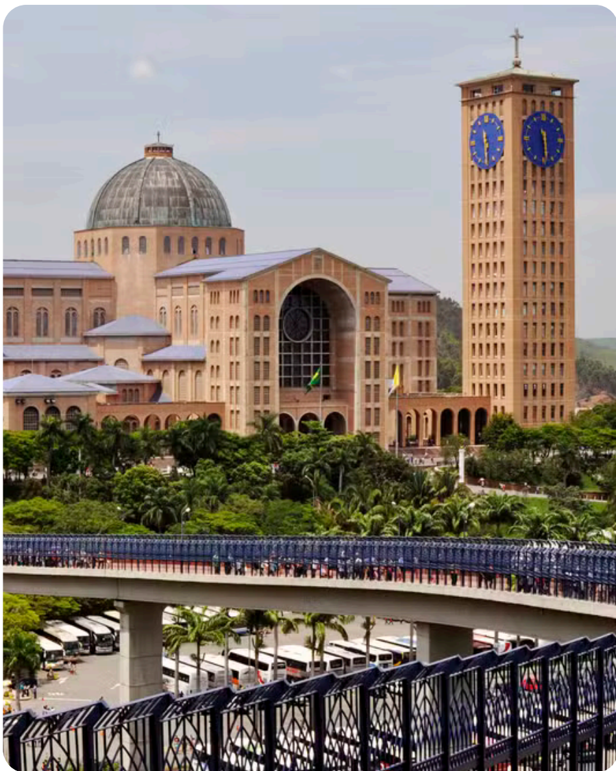
Santuário de Nossa Senhora Aparecida Aparecida - SP