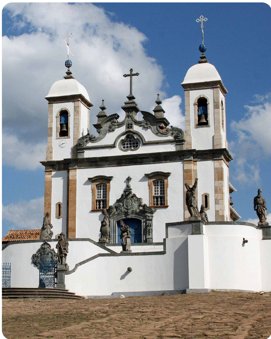
Santuário Bom Jesus de Matosinhos Congonhas - MG