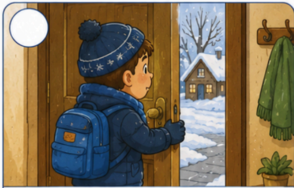
Volta para casa.