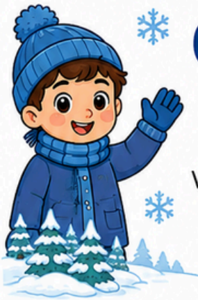
GRÁFICO DO CLIMA DE INVERNO