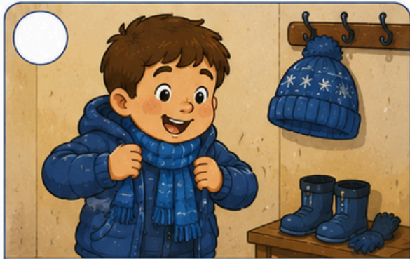
Veste roupas de inverno.