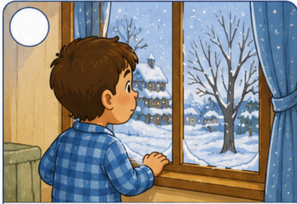
Olha pela janela.