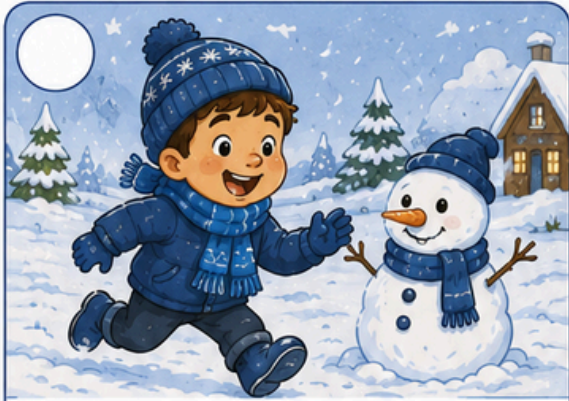
Sai para brincar.

Observe as cenas e numere os acontecimentos na ordem em que eles acontecem.