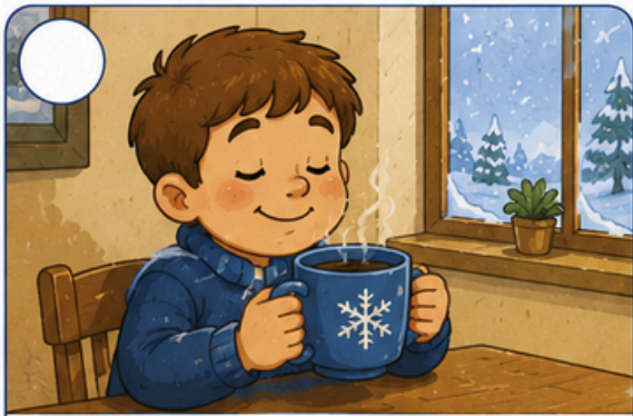
Toma chocolate quente.