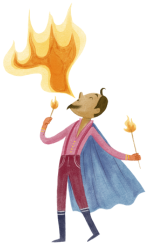
cuspidor de fogo