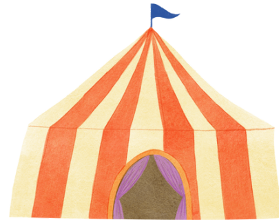
lona de circo